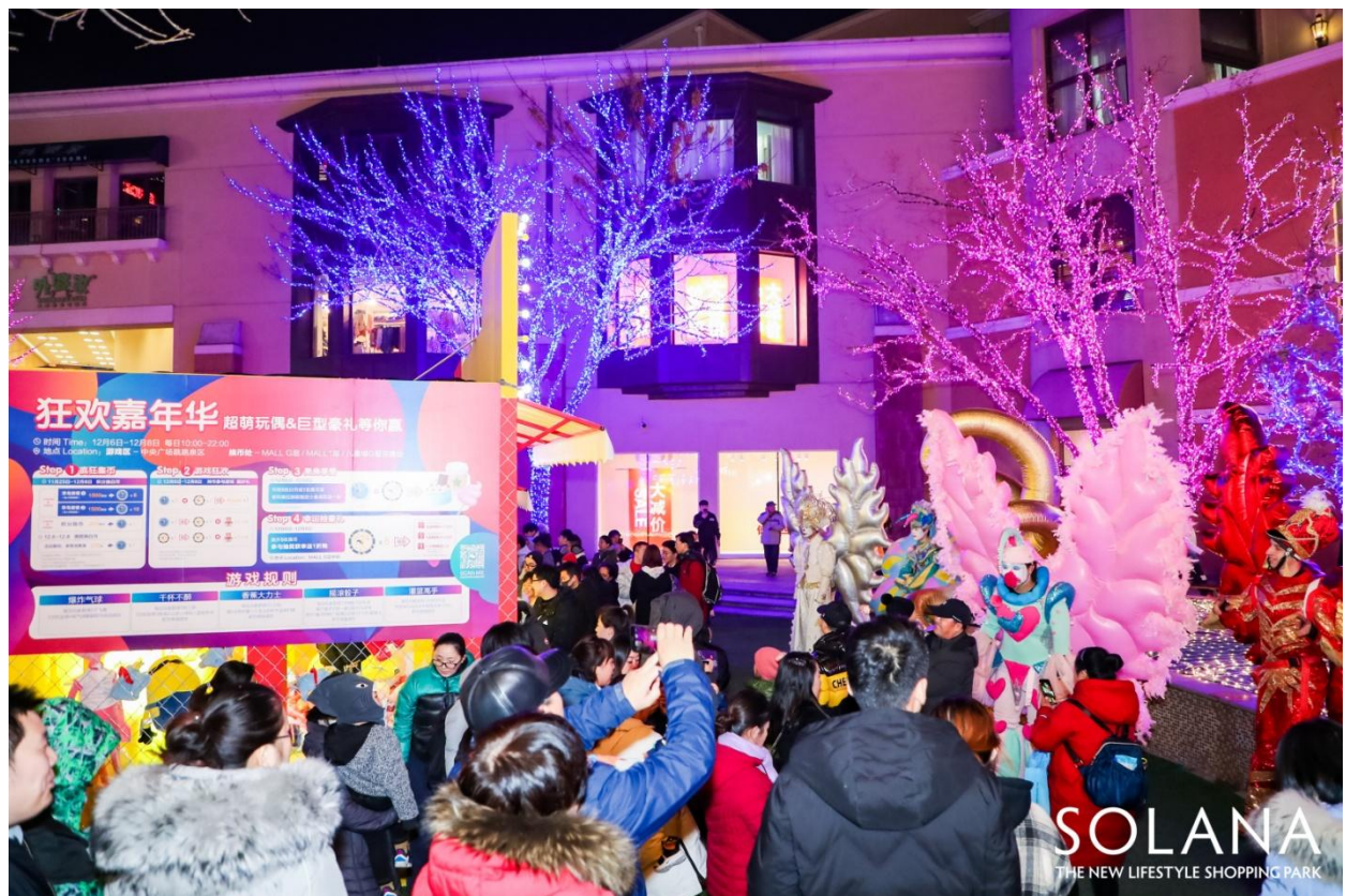
SOLANA 蓝色港湾-跳跳泉广场-嘉年华现场