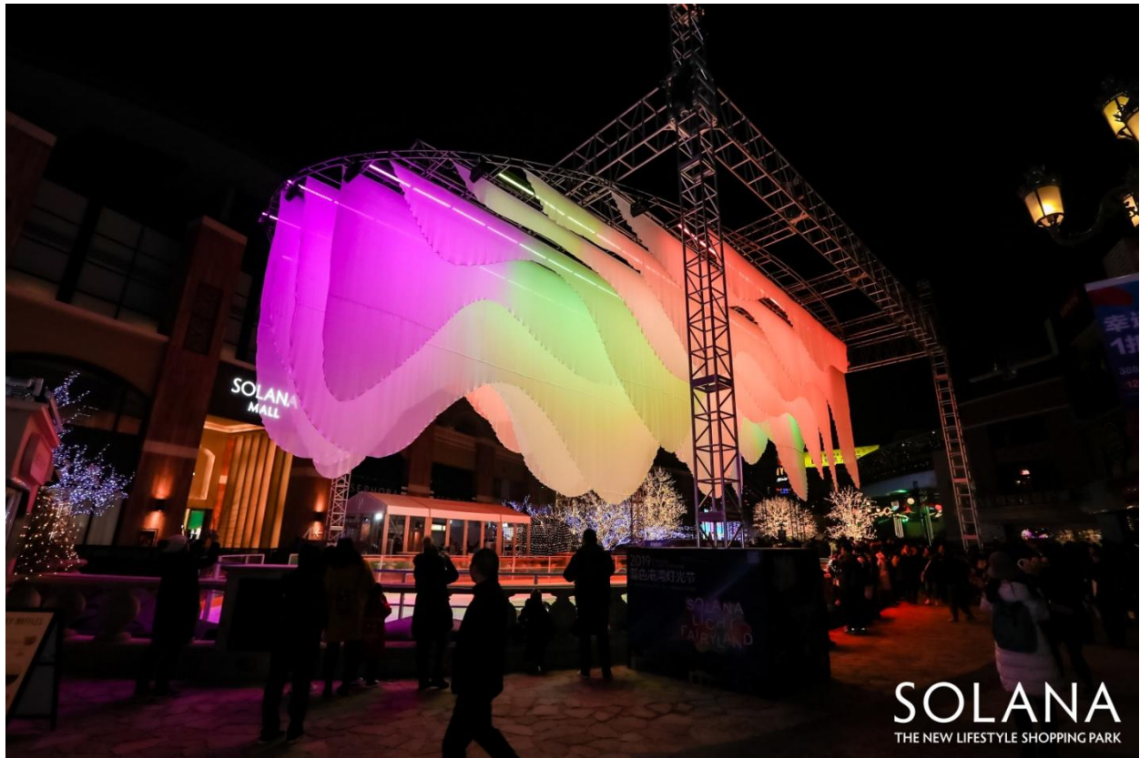
SOLANA 蓝色港湾-中央广场-灯光节装置

2008 年，SOLANA 蓝色港湾开创行业先河，首次举办大型国际艺术灯光展览，引领商业消费趋势，迄今，已连续举办了十二年。每一年都甄选世界级艺术大师，带来最璀璨的灯光盛宴，让大众近距离体验文化艺术的魅力。