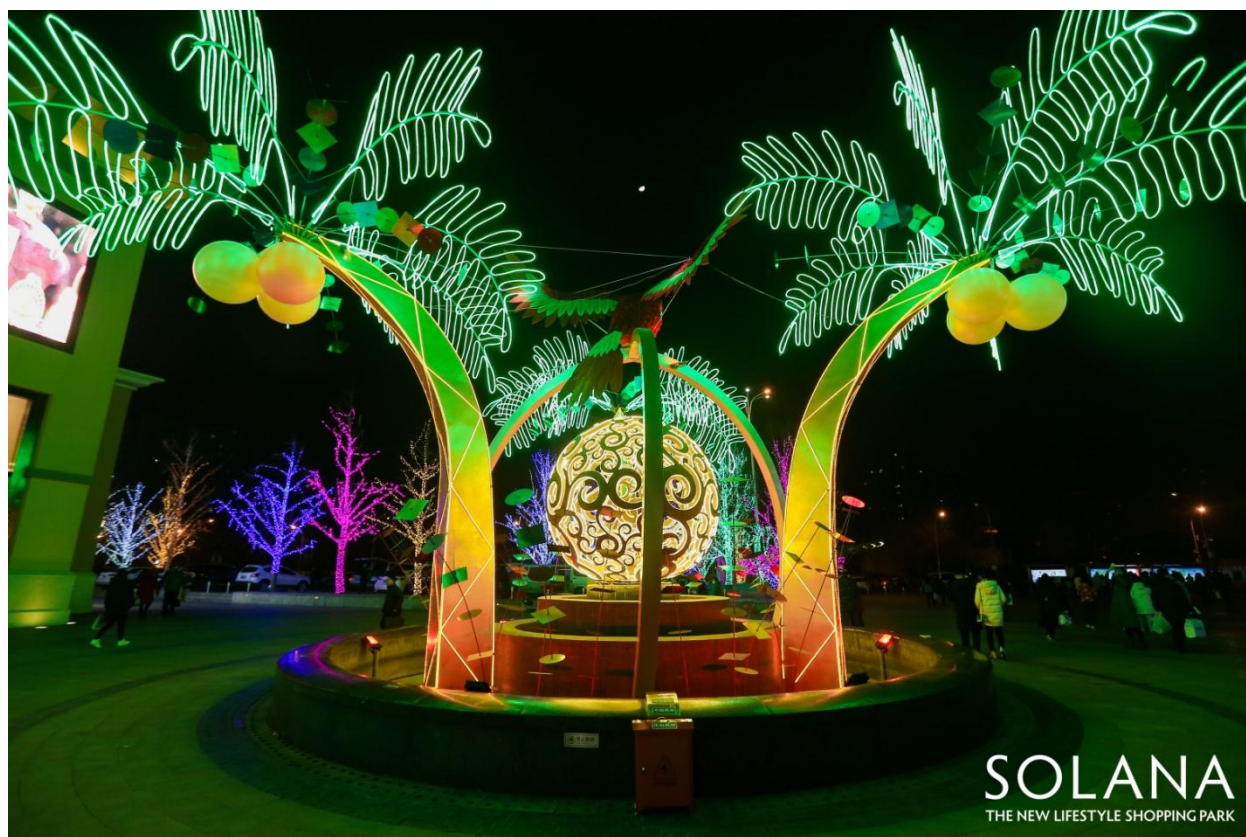
SOLANA 蓝色港湾-铜球广场-James Glancy Design 作品