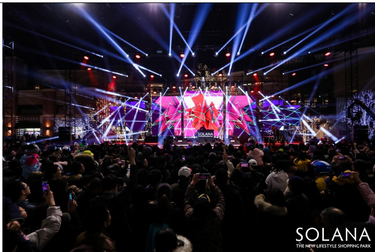
SOLANA 蓝色港湾-中央广场-灯光节开幕式现场