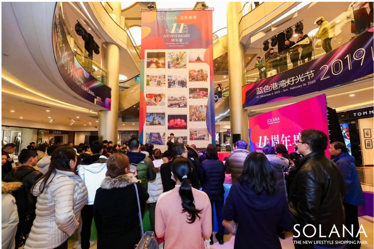
SOLANA 蓝色港湾-MALL 中庭-11 周年庆现场

SOLANA 蓝色港湾一直被视为京城商业地标，今年还成为北京市商务局打造的首批“夜京城”商圈。在极具艺术美学灯光的点缀下，SOLANA 蓝色港湾再树标杆，为京城的“夜经济”打造了范本。