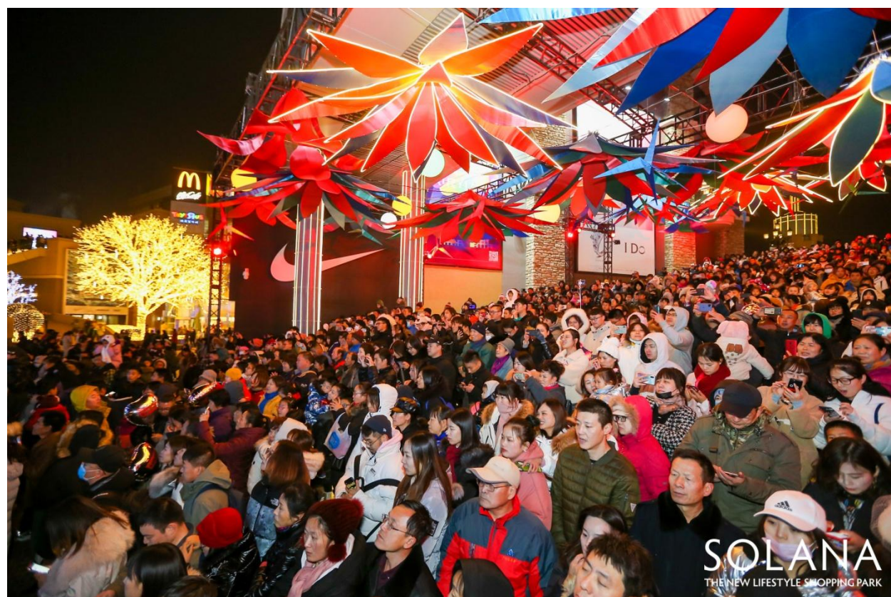
SOLANA 蓝色港湾-爱神广场大台阶-灯光节开幕式现场