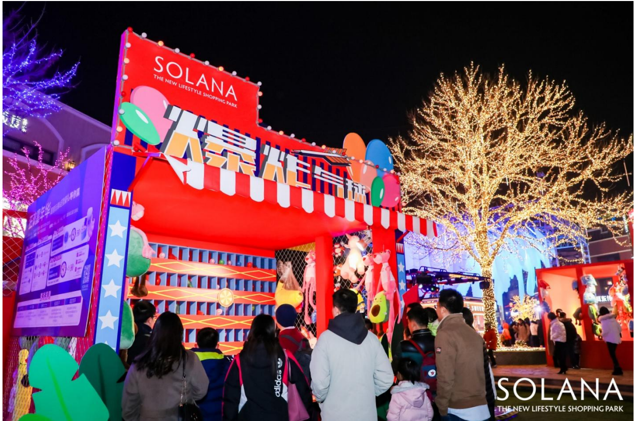
SOLANA 蓝色港湾-跳跳泉广场-嘉年华现场

与 2019 蓝色港湾灯光节同时进行的，还有从 12 月 6 日-8 日连续三天举办的周年庆活动及欢乐嘉年华。丰富的体验内容，多维触达消费者，SOLANA 蓝色港湾践行初心，极力挖掘大众高级审美体验，打造高端别致的生活方式。