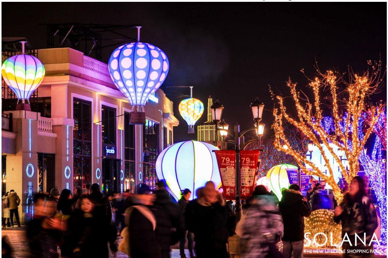
SOLANA 蓝色港湾-湖畔美食街-James Glancy Design 作品