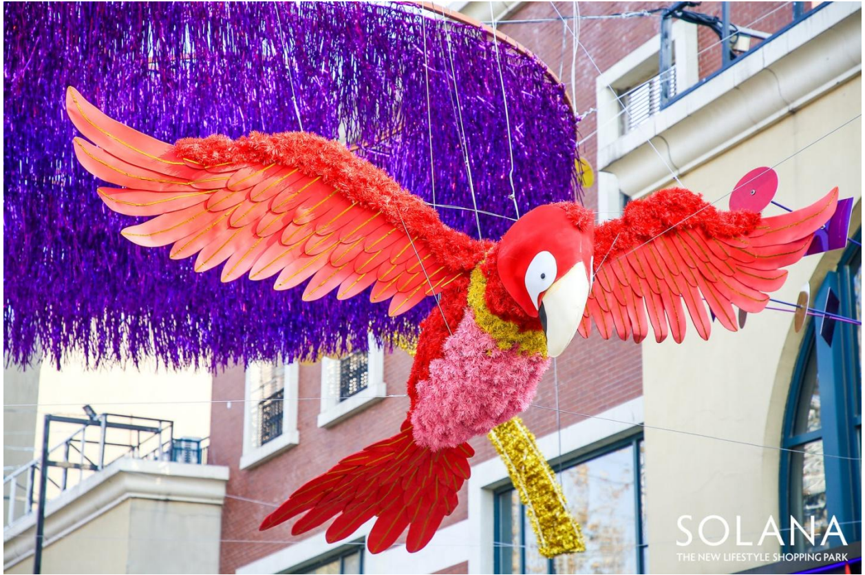
SOLANA 蓝色港湾-亮马食街-James Glancy Design 作品