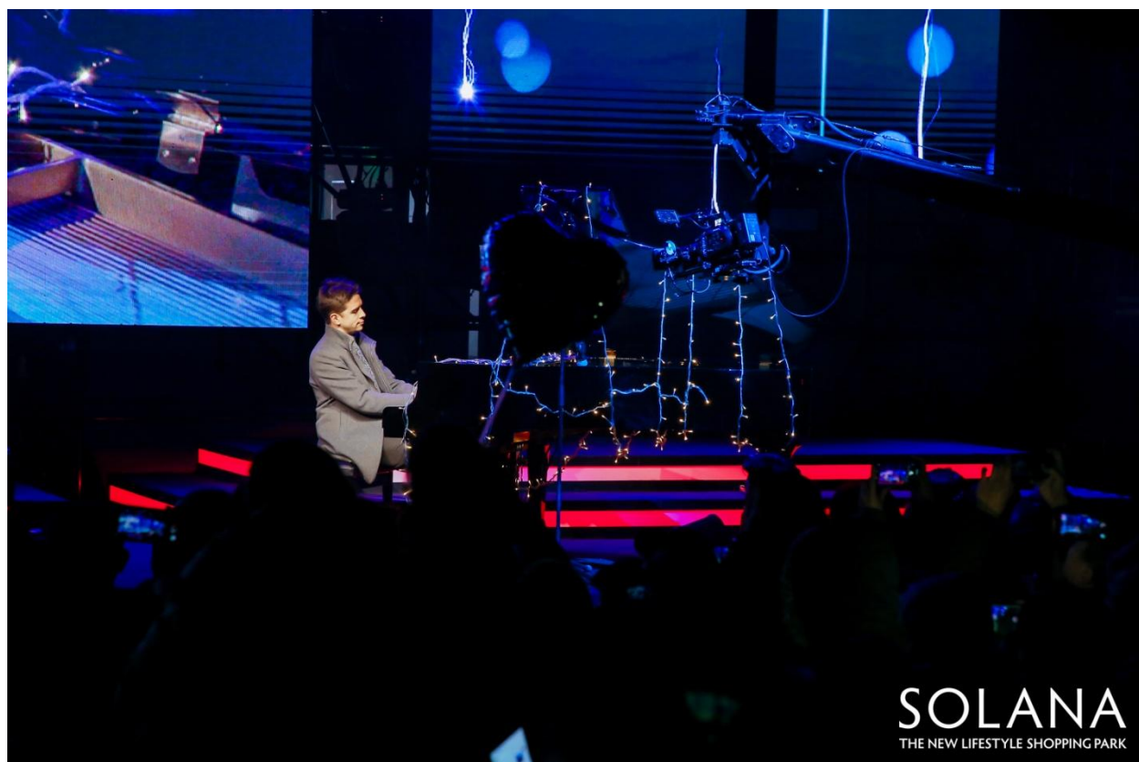
SOLANA 蓝色港湾-中央广场-灯光节开幕式现场