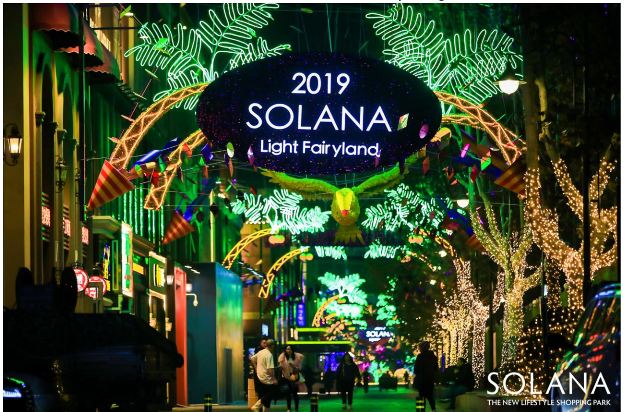
SOLANA 蓝色港湾-亮马食街-James Glancy Design 作品