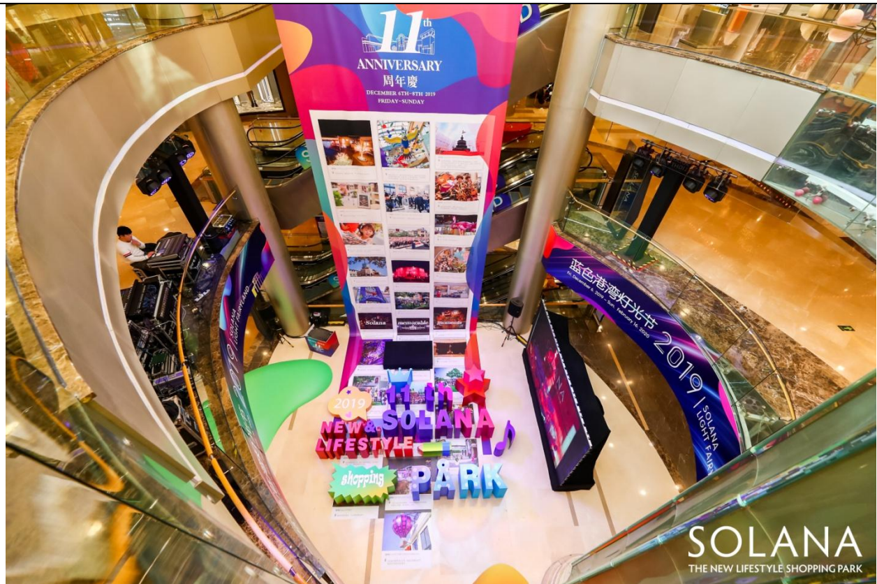
SOLANA 蓝色港湾-MALL 中庭-11 周年庆现场