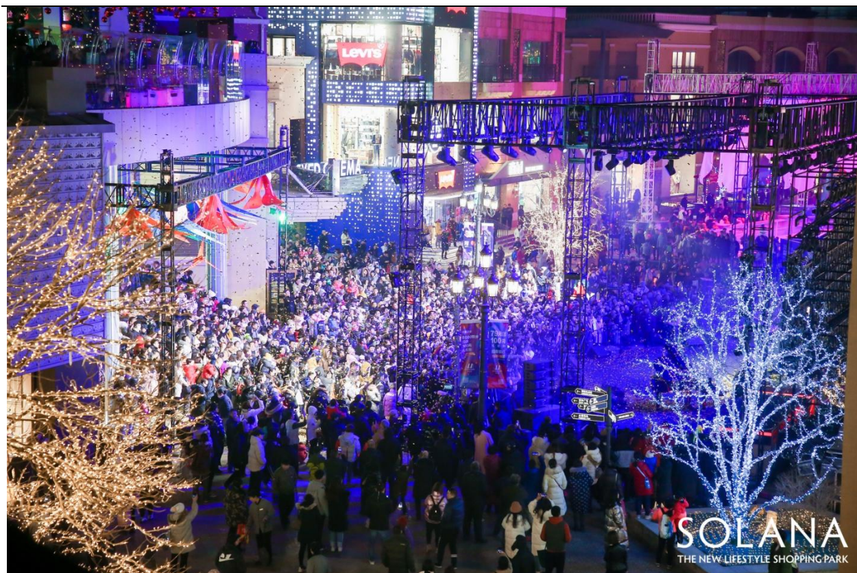
SOLANA 蓝色港湾-中央广场-灯光节开幕式现场