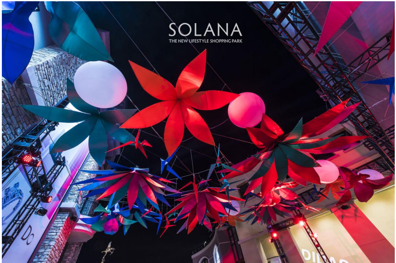
SOLANA 蓝色港湾-爱神广场大台阶-灯光节装置

作为北京标志性灯光节的缔造者，SOLANA 蓝色港湾又一次用灯光艺术定义了别致的高端生活方式。