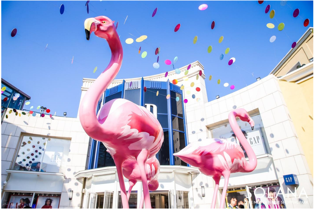
SOLANA 蓝色港湾-adidas 小广场-James Glancy Design 作品