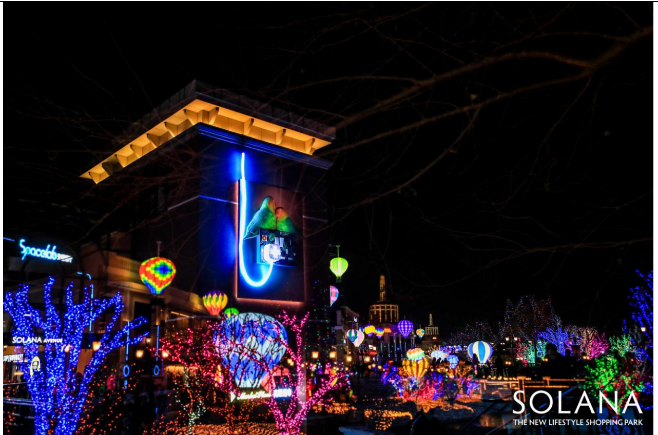
SOLANA 蓝色港湾-湖畔美食街-James Glancy Design 作品