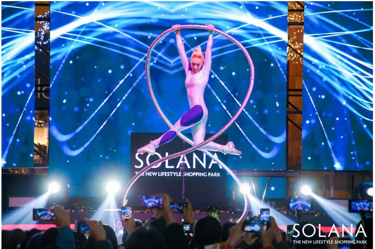
SOLANA 蓝色港湾-中央广场-灯光节开幕式现场